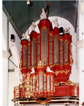
Petruskerk Woerden

Nadere informatie ook over het Vleutense orgel volgt later.