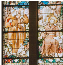
detail van één van de ramen

Vermeldenswaard zijn ook de prachtige gebrandschilderde ramen van Ed. Löhner (1853-1918). De ramen worden momenteel gerestaureerd.