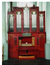
Wadsworth (1862) en Oldknow (1886)