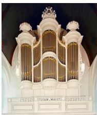
Kam & Van der Meulen (1840)

De orgels van de Grote of St.-Michaëlskerk en de St.-Franciscuskerk stonden in het centrum van de belangstelling: