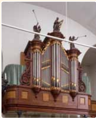
HERVORMDE DORPSKERK (1871) LEUSDEN-ZUID

Het betreft een klassiek vijfledig model met de gebruikelijke drie ronde torens en gedeelde tussenvelden. Zeer typerend voor Knipscheer II zijn de vleugelstukken, bestaande uit een combinatie van met bladwerk omrande voluten die aan de bovenzijde door een horizontale lijst worden afgesloten. Het front van het in 1871 door Knipscheer II gebouwde orgel van de Hervormde Dorpskerk te Leusden-Zuid is nauw verwant met dat te Baambrugge.