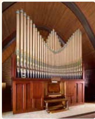
EMMAÜSKERK (1874), AMERSFOORT

Ook het werk van de beroemde Engelse orgelmakers Henry Willis & Son is – sedert 1985 – in de provincie Utrecht vertegenwoordigd, in de Emmaüskerk te Amersfoort.