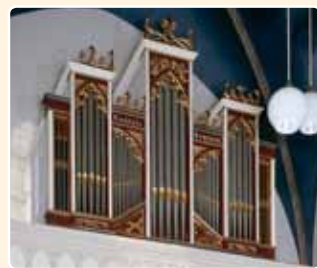
VOORMALIG ST.-HIERONIMUS (ca. 1880) UTRECHT