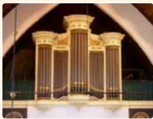
HERVORMDE KERK (1881) DRIEBERGEN (Sto)

Dit laatste ontwerp zou weer model staan voor sommige orgels van P. Maarschalkerweerd, die jarenlang bij de firma Bätz in dienst was geweest, zoals zijn orgel in de R.K. St. Bavokerk te Harmelen (1858), of voor orgelfronten van de firma Flaes & Brünjes, die lange tijd vooruit kon met haar eigen variant van het Delftse orgelfront (Christelijk Gereformeerde Kerk te Soest, 1861; Hervormde Kerk te Westbroek, 1879; Hervormde Grote Kerk te Driebergen, 1881; Gereformeerde Westerkerk te Amersfoort, 1884).