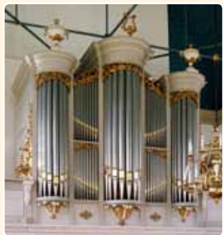
HERVORMDE KERK (1879) POLSBROEK