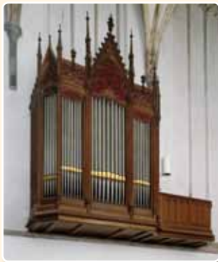
JANSKERK (1861), UTRECHT

Ook hier is het drieledig concept verbreed, nu met twee smalle extra