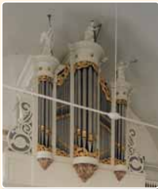
HERVORMDE KERK (1863) BAAMBRUGGE