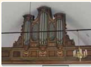
GEREFORMEERDE KERK (1904) BAAMBRUGGE (LK)

Mede door zijn scherpe prijsstelling kreeg hij menige orgelbouw-opdracht in Gereformeerde kerken. Zo ook in de Gereformeerde Kerk te Baambrugge, waar hij in 1904 een bescheiden eenmanuaals orgel bouwde.