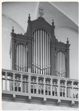
VOORMALIGE O.K. KERK VAN DE H. MARIA MINOR (1890), UTRECHT

velden worden boogvormig afgesloten. De overwegende neorenaissance -indruk wordt bewerkstelligd door de decoratieve elementen: gehalveerde frontons op de zijvelden, een gebroken fronton op het middenveld en stijlen in de vorm van pilasters met corinthische kapitelen. De fronten van de orgels in de voormalige Oud-Katholieke Kerk van de H. Maria Minor te Utrecht (1890; de kerk is thans een horecagelegenheid!) en de Hervormde Kerk te Harmelen (1902) borduren voort op deze indeling met neorenaissance-ornamentiek , zij het dat hier het middenveld door een volledig fronton wordt bekroond en de frontstijlen uitlopen in gotiserende pinakels.