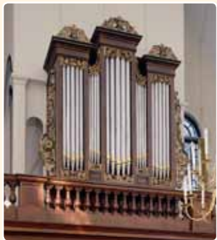
HERVORMDE KERK (1886) MAARSBERGEN (RCE)

Het instrument werd geleverd door de firma Goldschmeding te Amsterdam. Behalve in piano's en harmoniums handelde deze firma ook in kleine kerkorgels. In Maarsbergen werd het binnenwerk toegeleverd door P. van Dam. Wie het vlakke vijfledige orgelfront heeft vervaardigd is echter niet bekend, het vertoont geen Van Dam-kenmerken. Dat geldt wel voor het orgel in de Hervormde Kerk te Lopik (1891).