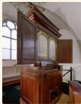
oud-KATHOLIEKE KERK (ca. 1880) OUDEWATER (RCE)

Even curieus als interessant is een vermoedelijk door Ehrenfried Leichel (Düsseldorf/Arnhem) rond 1880 gebouwd orgel dat sinds 2001 in de Oud-Katholieke Kerk te Oudewater staat.