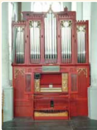
GROTE OF ST.-MICHAËLSKERK (1862) OUDEWATER (CB)

Het zeer compact gebouwde tweeklaviërs instrument heeft een vlak open front met drie velden, gescheiden door stijlen met pinakels. Het hoger geplaatste middenveld wordt geflankeerd door velden met de