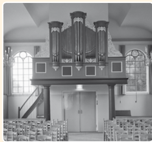
WITTE KERKJE (1904) HUIS TER HEIDE/ZEIST

De Friese tak van de familie Adema (Gebr. Adema, Leeuwarden) leverde in 1904 een eenmanuaals mechanisch orgel in het Witte Kerkje te Huis ter Heide (Zeist), met een vijfledig front (drie ronde torens, gescheiden door ongedeelde tussenvelden), voorzien van fraai snijwerk.