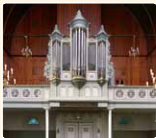
HERVORMDE KERK (1894) OUD-ZUILEN