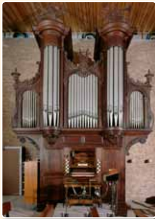
RAFAËLKERK (1856), UTRECHT

In 1972 kocht de parochie van de H. Geest in Overvecht (thans Rafaël) een historisch orgel aan.