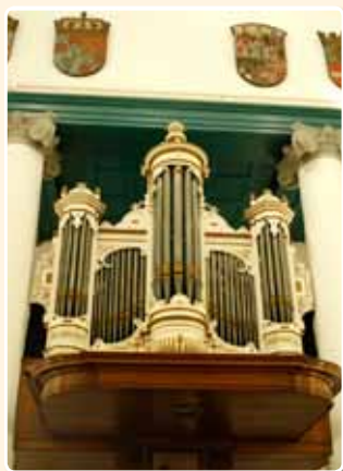
HERVORMDE KOEPELKERK (1907) RENSWOUDE (REL)

Rond 1907 bouwde de toen in Leiden gevestigde orgelmaker G. van Leeuwen een orgel in de Hervormde Kerk te Oud-Loosdrecht. Het front van dit instrument werd in 1977 geplaatst voor het orgel van de Hervormde Koepelkerk te Renswoude.