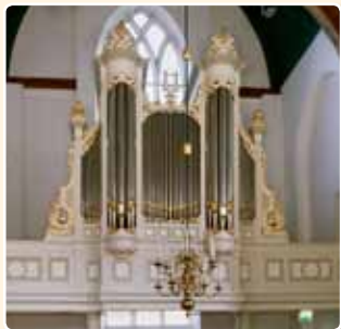
HERVORMDE KERK (1891), LOPIK (RCE)

Het instrument werd geleverd door de firma Goldschmeding te Amsterdam. Behalve in piano's en harmoniums handelde deze firma ook in kleine kerkorgels. In Maarsbergen werd het binnenwerk toegeleverd door P. van Dam. Wie het vlakke vijfledige orgelfront heeft vervaardigd is echter niet bekend, het vertoont geen Van Dam-kenmerken. Dat geldt wel voor het orgel in de Hervormde Kerk te Lopik (1891).