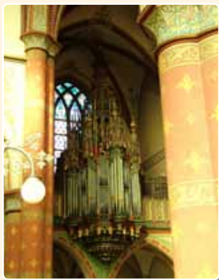
St.-NICOLAASKERK (1879) NIJEUWEGEIN-JUTPHAAS

omzwervingen met een eigentijds front terecht gekomen in de Gerardus Majellakerk te Utrecht. Het front zelf bevond zich tot enkele jaren geleden in de Hervormde Kerk van Wadenoyen maar is thans opgeslagen. In 1872 kwam een groot nieuw orgel tot stand voor de St.-Dominicuskerk (aan de Mariaplaats) te Utrecht. De opzet van dit orgel was vergelijkbaar met die van de iets latere instrumenten te Leiden (Hartebrugkerk) en Schiedam (Havenkerk). Vanwege kerksluiting verhuisde dit instrument in 1939 naar de H. Barbarakerk te Bunnik. Helaas ging toen de fraaie neobarokke orgelkas verloren. Daarnaast had deze verhuizing tot gevolg dat het Bunnikse Maarschalkerweerd-orgel (1876) naar Zwijndrecht verhuisde. Hoewel het front van dit orgel van neogotische decoratie is voorzien is de opzet daarvan nagenoeg gelijk aan die van het voormalige Dominicus-orgel.