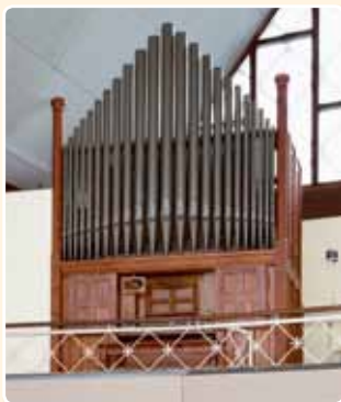
GEREFORMEERDE KERK (1878)