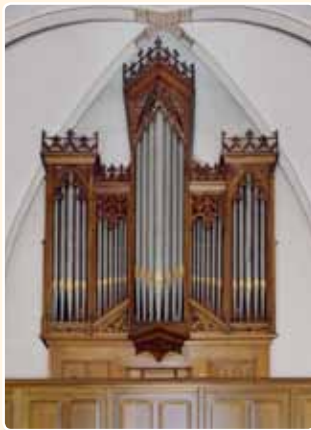
St.-JOH. DE DOPERKERK (1879) MIJDRECHT (RCE)

Ook het orgel in de St.-Johannes de Doperkerk te Mijdrecht dateert uit 1879.