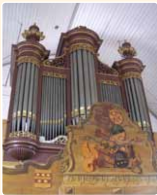
HERVORMDE KERK (1870) WAVERVEEN (MR)