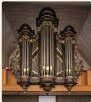
HERVORMDE CALVIJNKERK (1861) BAARN

De orgelmakers Flaes & Brünjes hadden hun opleiding bij de firma J. Bätz & Co ontvangen. Zij vestigden zich in 1842 als zelfstandige orgelmakers in Amsterdam; na het terugtreden van Brünjes in 1869 zette Flaes het bedrijf tot zijn overlijden in 1889 voort. Het in hoofdlijnen vrijwel steeds door deze firma toegepaste standaard-frontontwerp is ontleend aan het rugwerk van het Bätz-orgel in de Nieuwe Kerk te Delft (1840). Het betreft een vijfledig frontontwerp, uitgaande van een blokvorm, met drie ronde torens en ongedeelde tussenvelden. Flaes & Brünjes namen dit model als voorbeeld voor hun orgelfronten, waarbij zij echter per orgel de maatverhoudingen en de decoraties varieerden. Daarvan getuigen ook de vier Flaes (& Brünjes)-orgels in de provincie Utrecht: in de Christelijke Gereformeerde Kerk te Soest (1861; gebouwd voor de Hervormde Kerk te Andijk-West), de Hervormde Kerk te Waverveen (1870; afkomstig uit de Doopsgezinde Kerk te Kreil), de Hervormde Kerk te Westbroek (1879;