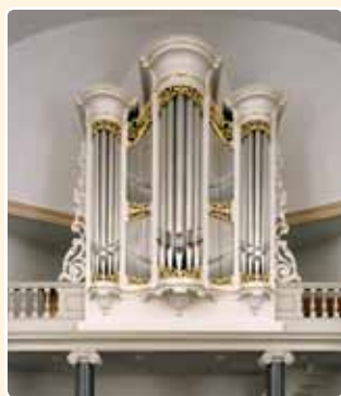
HERVORMDE KERK (1868) NIEUWEGEIN-JUTHAAS (RCE)

De provincie Utrecht is maar liefst twee orgels uit het bescheiden oeuvre