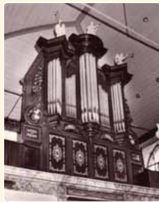
HERVORMDE KERK (1898, VROEGERE SITUATIE), KAMERIK