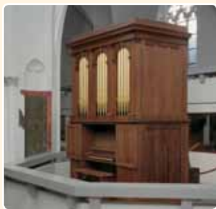
BUURKERK - MUSEUM (1855) UTRECHT (RCE)

Het oudste instrument is een voor ons land uniek kerkdraaiorgel; er zijn rollen met Engelse kerkliederen, maar er is ook een handklavier. Het instrument is in 1855 gebouwd door J.W. Walker (Londen) en staat sinds 1984 in het Nationaal Museum van Speelklok tot Pierement (Buurkerk) te Utrecht.