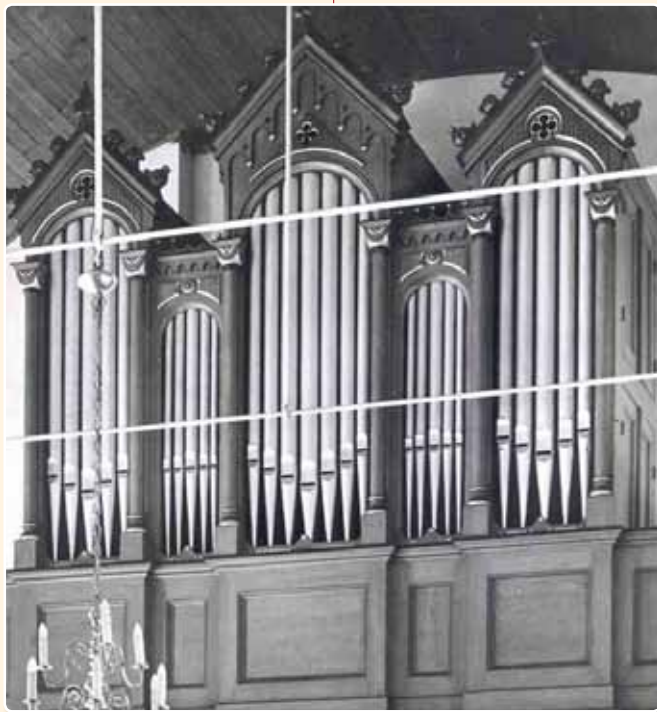
HERVORMDE KERK (1912), BUNNIK (UA)

En hiermee eindigt deze reis langs Utrechtse orgelfronten uit de periode 1850-1914. De vermelde orgels zijn het bekijken, maar ook het beluisteren, meer dan waard. Wij hopen daartoe een goede aanzet te hebben gegeven.