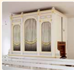
BROEDERGEMEENTE - KLEINE KERKZAAL (1877), ZEIST (RCE)

Broedergemeente te Zeist gebouwde orgel.