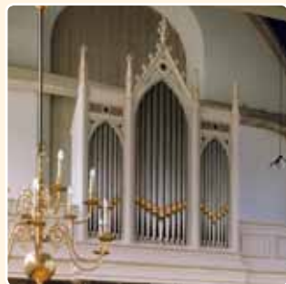
HERVORMDE KERK (1860) BUNSHOTEN

Het meest toegepast is de neogotische variant van het driedelige front-concept. Een vroeg voorbeeld is het orgel van de Hervormde Kerk te