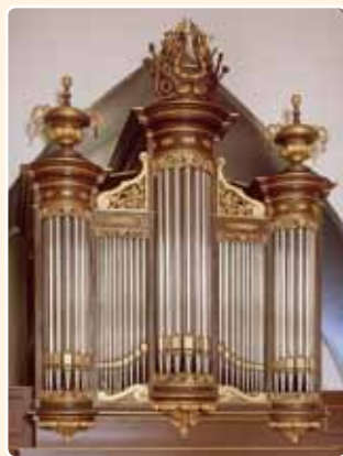
WESTERKERK - GEREFORMEERD VRIJGEMAakt (1884), AMERSFOORT (RCE)