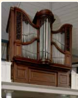
GEREFORMEERDE KERK (1880)

De Gereformeerde Kerk te Loenen aan de Vecht bezit sinds 1989 een heel bijzonder Engels orgelfront (het staat voor een Nederlands binnenwerk uit 1941/1989).