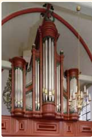
HERVORMDE KERK (1881)