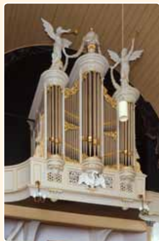
LUTHERSE KERK (1880), UTRECHT (RCE)

De ornamentiek doet sterk neobarok aan. De Lutherse swaan onder de middentoren was nog afkomstig van het vorige orgel, maar de vaas op de middentoren met afhangende