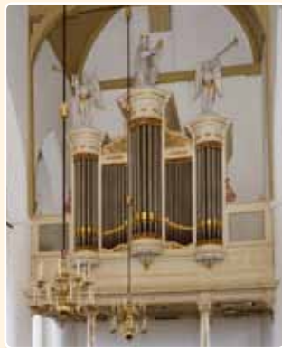
HERVORMDE KERK (1879) WESTBROEK (RCE)