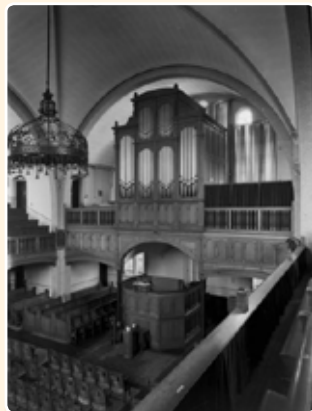
NIEUWE KERK (1913), UTRECHT (UA)

Deze orgels staan qua vormgeving, dispositie en bouwwijze nog geheel in de traditie van zijn leermeester. Het orgelfront te Bunnik is sterk geïnspireerd door dat van het