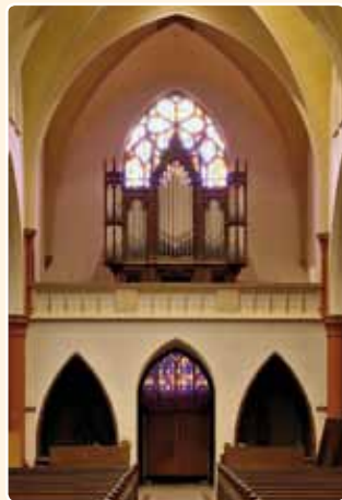
ST.-JOSEPHKERK (1872), UTRECHT (CP)

In de in 1901 voltooide St.-Josephkerk aan de Draaiweg te Utrecht, ontworpen door G.A. Ebberts, bevindt zich sinds 1919 een zeer belangrijk instrument.