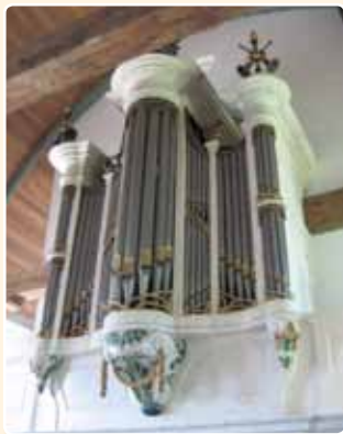
HERVORMDE KERK (1852) VREELAND (MR)

Het oudste bewaard gebleven Knipscheer-orgel in de provincie Utrecht dateert uit 1852 en staat in de Hervormde Kerk te Vreeland.