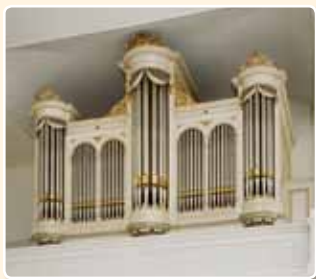
BROEDERGEMEENTE - GROTE KERKZAAL (1883), ZEIST (RCE)

Deze fronten waren ontworpen in de zogenaamde rondboogstijl , toen ook wel als Byzantijnse stijl aangeduid, een mengeling tussen neoclassicistische hoofdvormen en neoclassicistische en neoromaanse ornamentiek . Delen van deze fronten werden door dezelfde orgelbouwers toegepast in kleinere orgels: in de Hervormde Kerk te Amerongen (C.G.F. Witte, 1862), de Hervormde Kerk te Jaarsveld (C.G.F. en J.F. Witte, 1872), de kerk van de Evangelische Broedergemeente te Zeist (J.F. Witte, 1883).