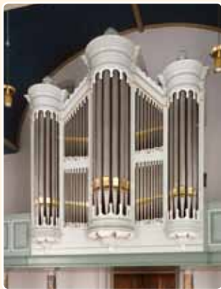
HERVORMDE KERK (1872) JAARSVELD (RCE)

Een unieke variant van het vijfledige frontschema toont het orgel in de grote kerkzaal van de Broedergemeente te Zeist (1883). Hier zijn de tussenvel-den niet verticaal, maar horizontaal gedeeld door zuiljes.