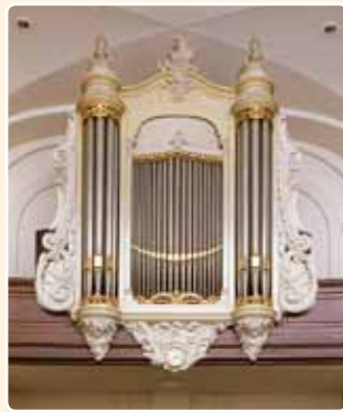
DOOPSGEZINDE KERK (1870) UTRECHT (RCE)

Hier wordt een breed vlak middenveld geflankeerd door smalle ronde torens. Bij het laatstgenoemde front zijn de decoraties – zonder twijfel volgens ontwerp van de bij dit project betrokken architect N.J. Kamperdijk – ontleend aan het rococo, hetgeen dit front een opmerkelijke zwierigheid verleent.