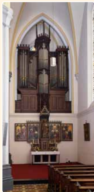
H. MARIA TENHEMELOPNEMING (1883) VIANEN

Het orgel in de kerk van de H. Maria Tenhemelopneming te Vianen is om meerdere redenen bijzonder.