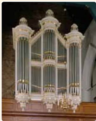
HERVORMDE KERK (1858) BEUSICHEM (RCE)

door de sobere decoratie maakt het Amerongse orgel een voor het huis Witte karakteristieke 'deftige' indruk. Er zijn geen vleugelstukken, de torens worden bekroond door met tootlijsten 'omcirkelde' pijnappels, en het blinderingsnijwerk bestaat uit betrekkelijk eenvoudig ogende boogfriezen (boven) en tootlijsten (onder). Onder de torens zijn consoles met omkrullend bladwerk geplaatst.