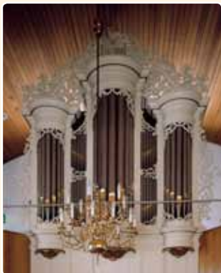
HERVORMDE KERK (1860) ACHTERBERG (RCE)

Het front is vijfledig: een ronde middenveld, twee lagere ronde zijtoren en gedeelde tussenvelden.