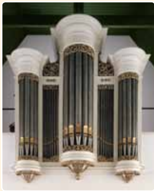
CHR. GEREFORMEERDE KERK (1861) SOEST

vanuit de Hervormde Kerk te Andijk alhier geplaatst) en de Westerkerk (Gereformeerd Vrijgemaakt) te Amersfoort (1884; afkomstig uit de Doopsgezinde Kerk te Haarlem, in 1996 in de oorspronkelijke toestand hersteld door Flentrop Orgelbouw).