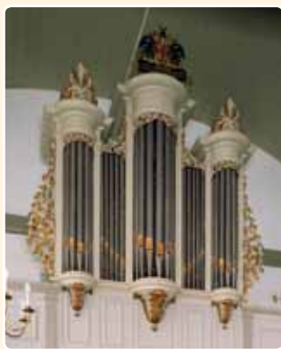
HERVORMDE KERK (1862) WERKHOVEN

De Noord-Brabantse orgelmakers J.J. Vollebregt & Zoon vervaardigden in 1862 een eenmanuaals orgel voor de Hervormde Kerk te Werkhoven.