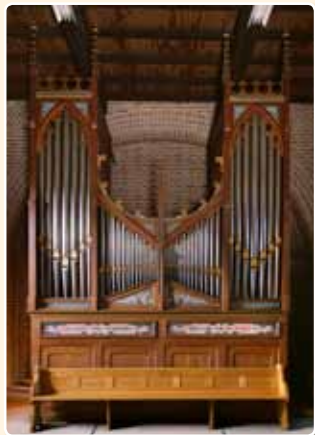
H. MARIA TENHEMELOPNEMING (1888) DE MEERN (RCE)

Een Maarschalkerweerd-orgel dat niet meer in de oorspronkelijke kerk staat is te vinden in de kerk van de H. Maria Tenhemelopneming in De Meern.