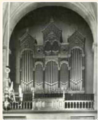
VOORMALIG ORGEL PIETERSKERK (1899) UTRECHT (UA)