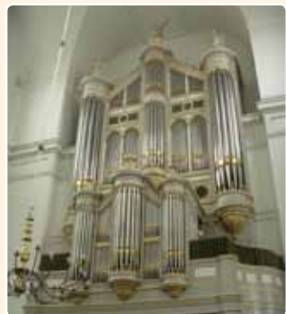
GROTE KERK (1853), GORINCHEM (MR)

Ook andere grootschalige frontontwerpen van de firma Bätz & Co. hadden een zekere invloed. We denken aan de orgels in de Grote Kerk te Gorinchem (C.G.F. Witte, 1853) en de Oude Kerk te Delft (C.G.F. Witte, 1857).