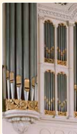
Vreeland, Hervormde Kerk Woudenberg, Hervormde Kerk De Meern, H. Maria Tenhemelopneming