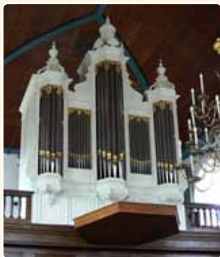
HERVORMDE KERK (1906) NIEUWEGEIN-VREESWIJK (BW)

In de Hervormde Kerk te Achterberg staat sinds 1958 een orgel van de Leeuwarder orgelmaker W. Hardorff uit 1860.