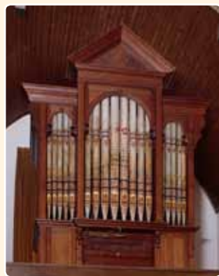
54 OUD-KATH. H. GEORGIUSKERK (1872) AMERSFOORT