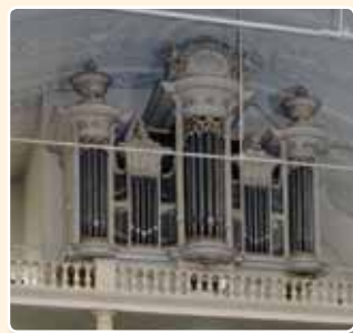
ST.-AUGUSTINUSKERK (1843) UTRECHT

orgel in de Nieuwe Kerk te Delft geassisteerd. De toepassing van het neoclassicisme bleef verder eigenlijk beperkt tot typische ornamenten, zoals pilasters, palmetten, rozetten en urnen, op verder traditionele neobarokke kassen, b.v. R.K. St. Augustinuskerk te Utrecht (H.D. Lindsen, 1843), Hervormde Kerk te Werkhoven (J.J. Vollebregt & Zn, 1862).