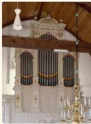
HERVORMDE KERK (1884) KOCKENGEN (RCE)

Het huis Witte creëerde ook neorenaissance-varianten van het drieledige fronttype. Het oudste voorbeeld daarvan is het orgel dat de firma J. Bütz & Co in 1884 bouwde voor de Oud-Katholieke H. Getrudiskerk te Utrecht; sedert 1969 staat het in de Hervormde Kerk te Kockengen.