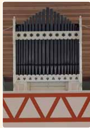
GEREFORMEERDE KERK VRIJGEMAAKT

In 1983 werd de Gereformeerde Kerk Vrijgemaakt te Soest voorzien van een door H.Linsell rond 1880 gebouwd orgel.