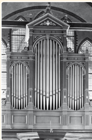
HERVORMDE KERK (1902) HARMELLEN (UA)

Het front van het helaas verdwenen Witte-orgel (1899) in de Pieterskerk te Utrecht was als het ware een schaalvergroting van het drieledige model Kockengen-Utrecht-Harmelen. Er waren ter weerszijden twee grote