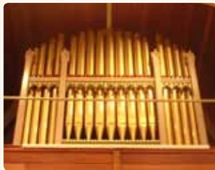
ONTMOETINGSKERK (ca. 1860), WILNIS (MR)

De Londense firma Henry Bevington & Sons is vooral bekend geworden door haar ruim 2000 kleine kerkorgels, waarvan een belangrijk deel voor dorpskerken was bestemd. In de Protestantse Ontmoetingskerk te Wilnis staat sinds 1980 een voorbeeld daarvan, rond 1860 gebouwd.