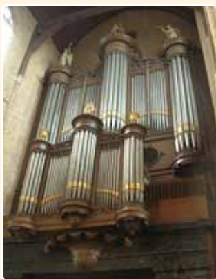
NIEUWE KERK (1840), DELFT (MR)

Karakteristiek is de rechthoekige blokvorm , waaraan alle andere elementen ondergeschikt worden gemaakt. Om het front passend te maken in zijn omgeving is het echter voorzien van neogotische ornamentiek . Suys, die in die periode verschillende werkzaamheden aan de Domkerk uitvoerde, had in Parijs gestudeerd en was op de hoogte van recente ontwikkelingen in de Franse kunst en architectuur. Zijn ontwerp, dat hij in 1830 samen met dezelfde orgelbouwers al in hoofdlijnen had toegepast in het nieuwe orgel in de Ronde Lutherse Kerk te Amsterdam, was een succes. Ook bij het prestigieuze ontwerp voor het orgel in de Nieuwe Kerk te Delft (J. Bätz & Co., 1840) werd voortgeborduurd op hetzelfde frontschema.