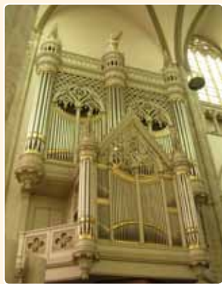
DOMKERK (1831), UTRECHT (MR)

is het front van het uit 1831 daterende grote orgel in de Domkerk in Utrecht, ontworpen door Suys en gebouwd door de gebroeders J. en J.M.W. Bätz, wel in massawerking geheel neoclassicistisch.