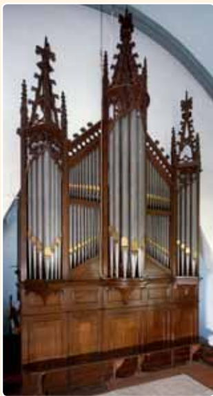
H. MARIA TENHEMELOPNEMING (1894) KOCKENGEN (RCE)

In de neoclassicistische zaalkerk uit 1854 van de H. Maria Tenhemelopneming te Kockengen bouwde Maarschalkerweerd in 1894 een bescheiden tweeklaviërs instrument.