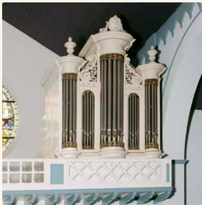
R.K. St.-BAVOKERK (1858)

Het oudst bewaarde instrument is dat van de R.K. St.-Bavokerk te Harmelen (1858).