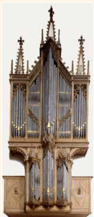
VOORMALIG ORGEL NICOLAÏKERK, UTRECHT HOOFDWERK LAAT GOTISCH, RUGWERK RENAISSANCE