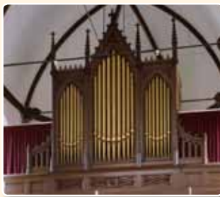
HERVORMDE KERK (1873), DOORN

deleeuwse gotische bouwkunst met spitsbogen en omhoog strevende lijnen . Ook in deze stijl was de firma Bätz & Co. van invloed, zij het dat zij de neogotiek hoofdzakelijk decoratief zag, bijvoorbeeld in het eerder genoemde front van het Utrechtse Domorgel, dat in wezen neoclassicistisch was. Ook het favoriete neogotische ontwerp van de firma in de tweede helft van de 19e eeuw was duidelijk gebaseerd op de neoclassicistische driedelige blokform , waarbij het middendeel bekroond werd met een gotische wimberg , b.v. Hervormde Kerk te Bunschoten (1860), Hervormde Janskerk te Utrecht (1861), Hervormde Kerk te Doorn (1873).