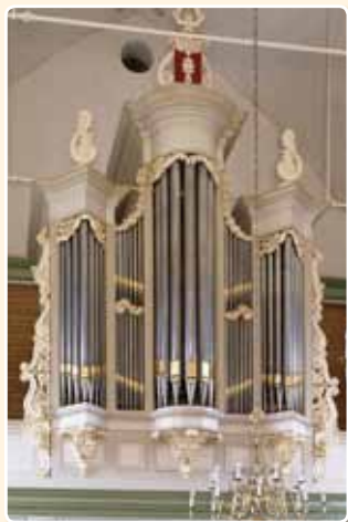
HERVORMDE KERK (1879), ZEGVELD

Zegveld, met een ronde middentoren, spitse zijtorens en gedeelde tussen-velden.