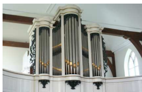
Lohman-orgel Dorpskerk De Bilt