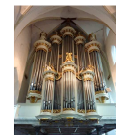
Joriskerk